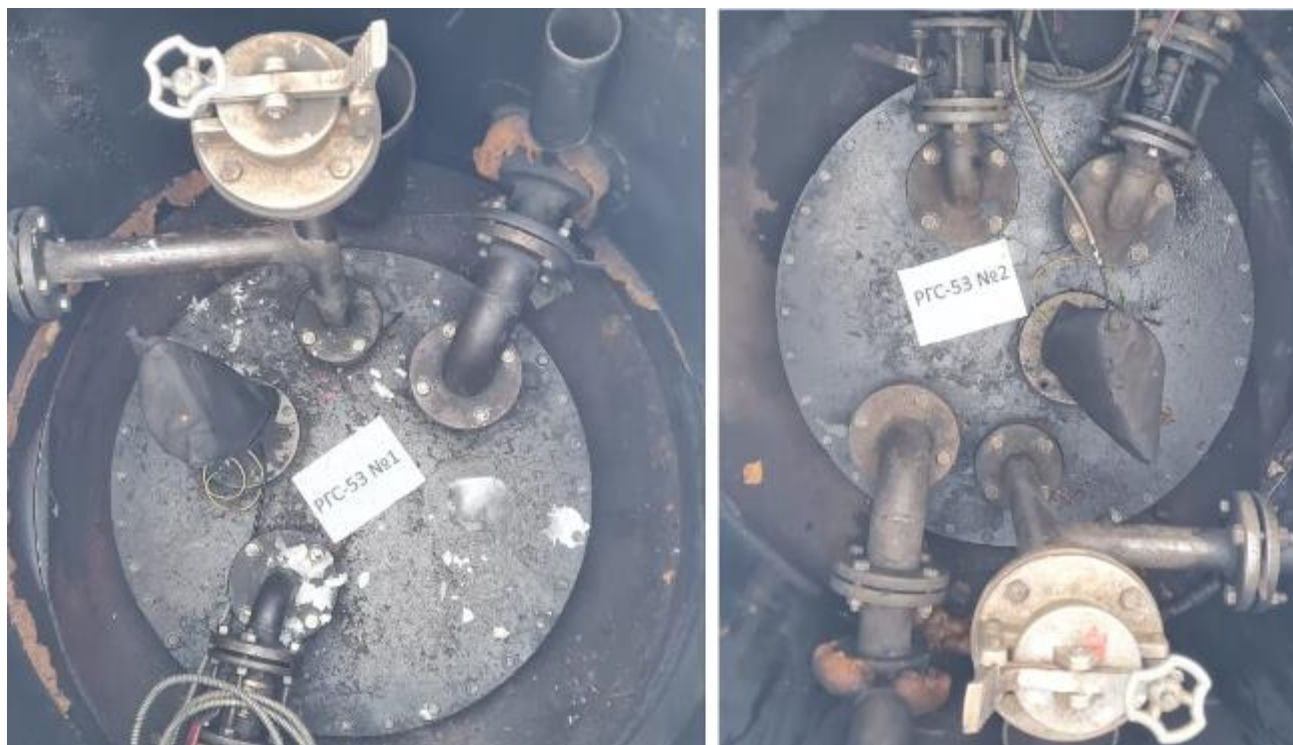
Рисунок 2 – Горловины резервуаров РГС-53 зав.№№ 1, 2