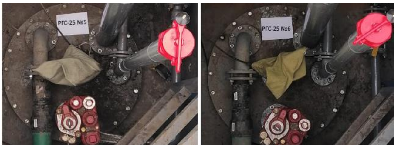
Рисунок 4 – Горловины резервуаров РГС-25 зав.№№ 5, 6

Пломбирование резервуаров РГС-25 не предусмотрено.