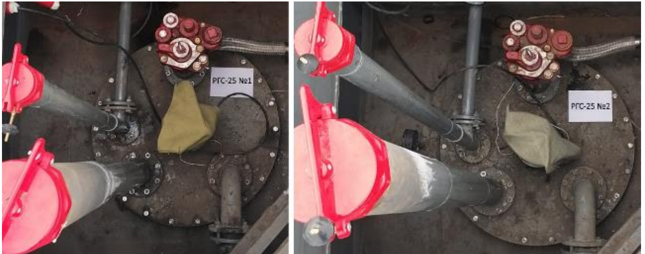
Рисунок 2 – Горловины резервуаров РГС-25 зав.№№ 1, 2