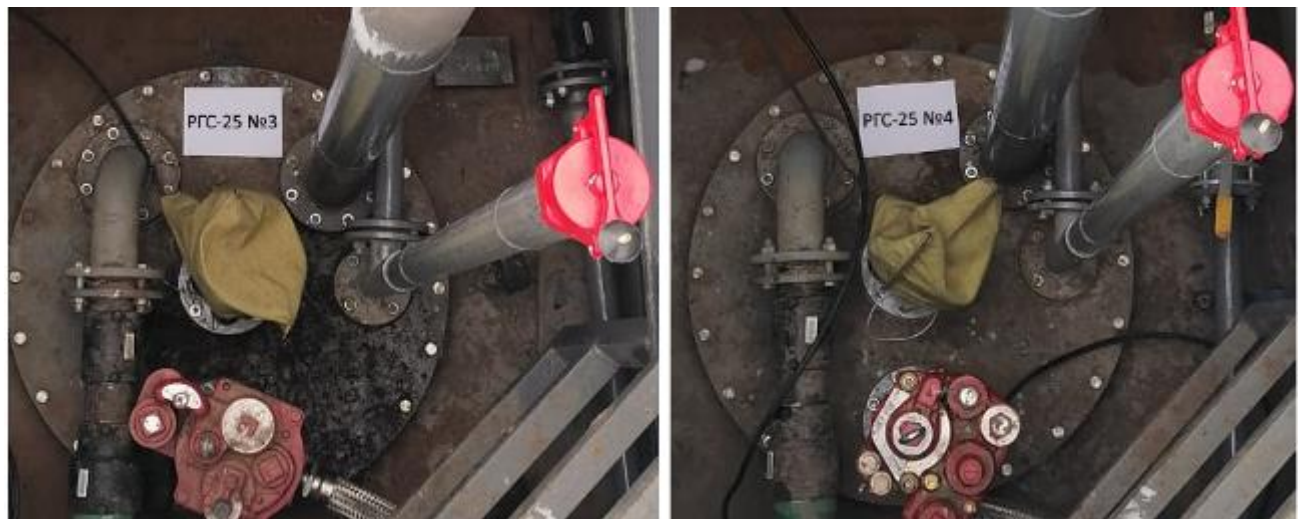
Рисунок 3 – Горловины резервуаров РГС-25 зав.№№ 3, 4