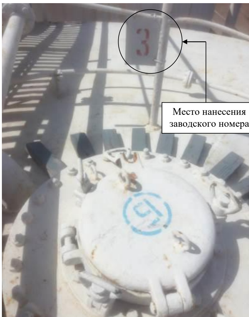
Р и с у н о к 3 – Общий вид замерного люка и места нанесения заводского номера

Заводские номера в виде цифровых обозначений, обеспечивающие идентификацию каждого экземпляра средств измерений, нанесены на номерные таблички танков, закрепленные на ограждении танка, методом окраса. Общий вид замерного люка и место нанесения заводского номера представлены на рисунке 3.