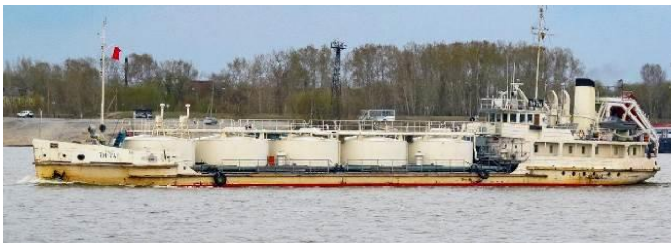
Р и с у н о к 1 – Общий вид танкера ТН-741

Общий вид танкера ТН-741 представлен на рисунке 1.