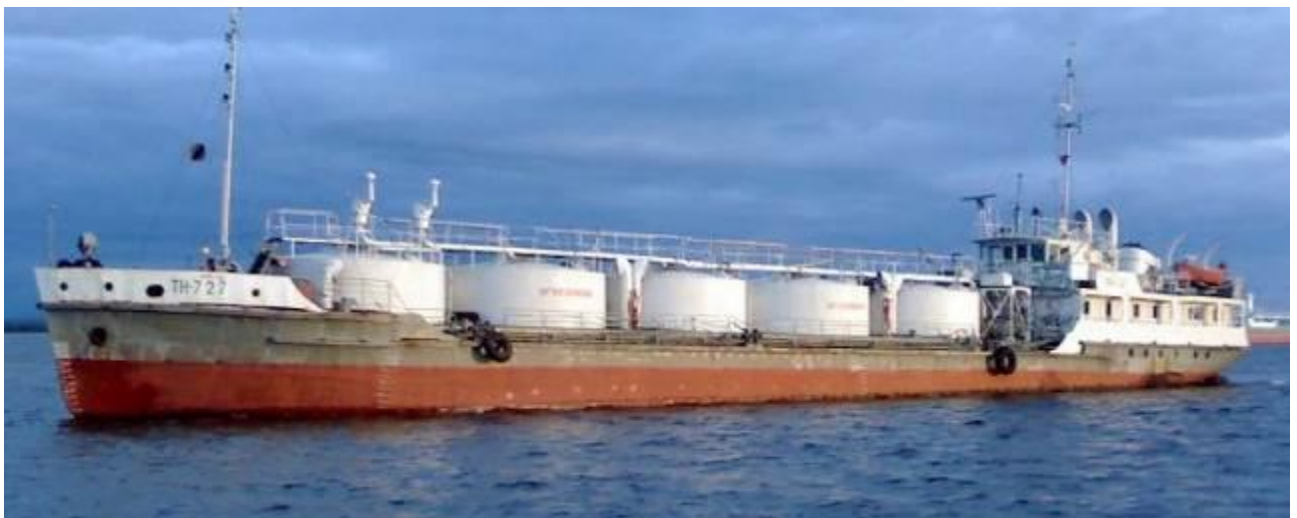
Р и с у н о к 1 – Общий вид танкера ТН-727

Общий вид танкера ТН-727 представлен на рисунке 1.