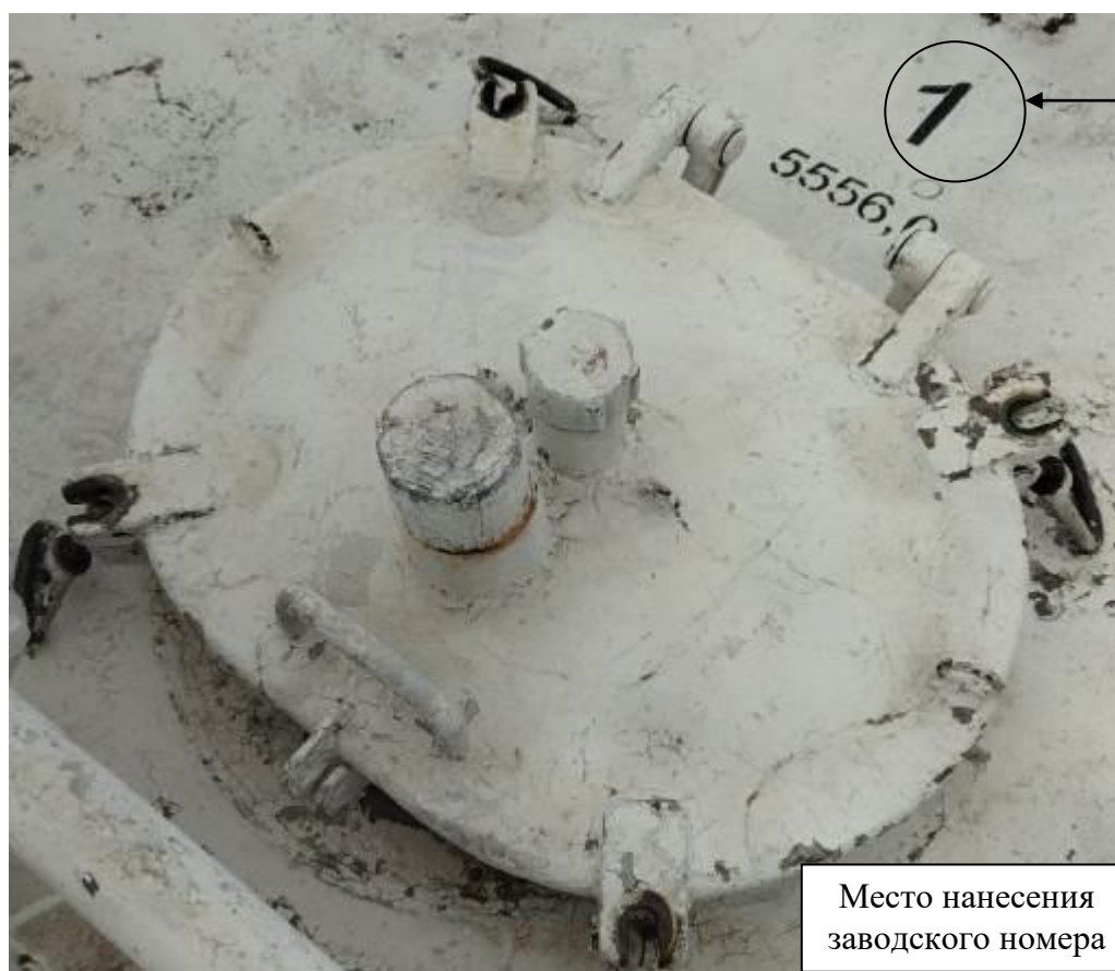
Р и с у н о к 3 – Общий вид замерного люка и места нанесения заводского номера

Заводские номера в виде цифровых обозначений, обеспечивающие идентификацию каждого экземпляра средств измерений, нанесены на корпус танков методом окраса. Общий вид замерного люка и место нанесения заводского номера представлены на рисунке 3.