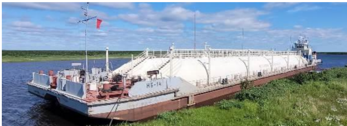
Р и с у н о к 1 – Общий вид нефтеналивной баржи НБ-14

Общий вид нефтеналивной баржи НБ-14 представлен на рисунке 1. Схематичное расположение танков на палубе нефтеналивной баржи НБ-14 представлено на рисунке 2.