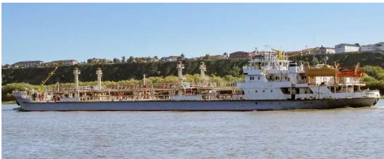
Р и с у н о к 1 – Общий вид танкера Тимофей Щербанев

Общий вид танкера Тимофей Щербанев представлен на рисунке 1.