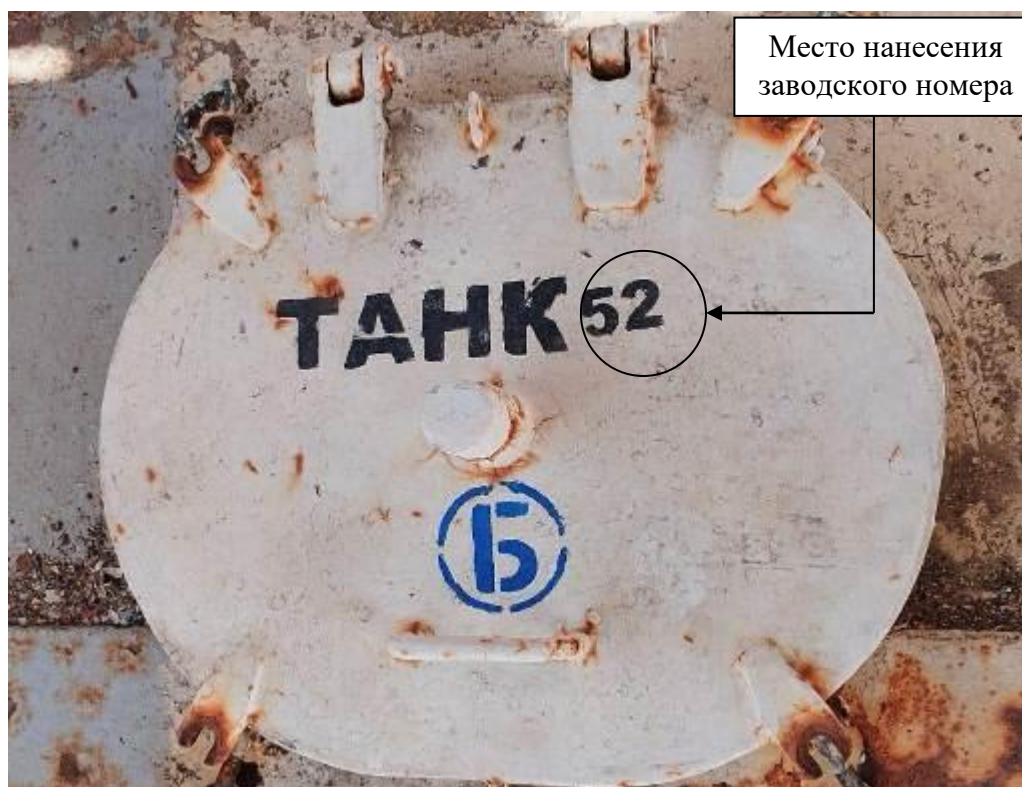
Р и с у н о к 3 – Общий вид замерного люка и места нанесения заводского номера

Заводские номера в виде цифровых обозначений, обеспечивающие идентификацию каждого экземпляра средств измерений, нанесены на замерные люки танков методом окраса. Общий вид замерного люка и место нанесения заводского номера представлены на рисунке 3.