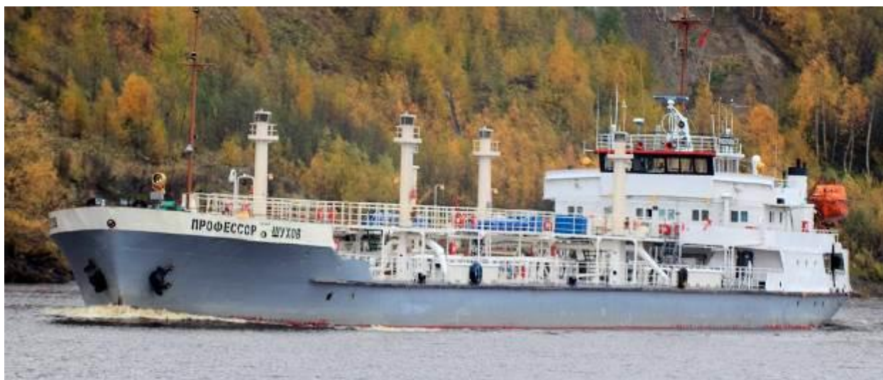
Р и с у н о к 1 – Общий вид танкера Профессор Шухов

Общий вид танкера Профессор Шухов представлен на рисунке 1.