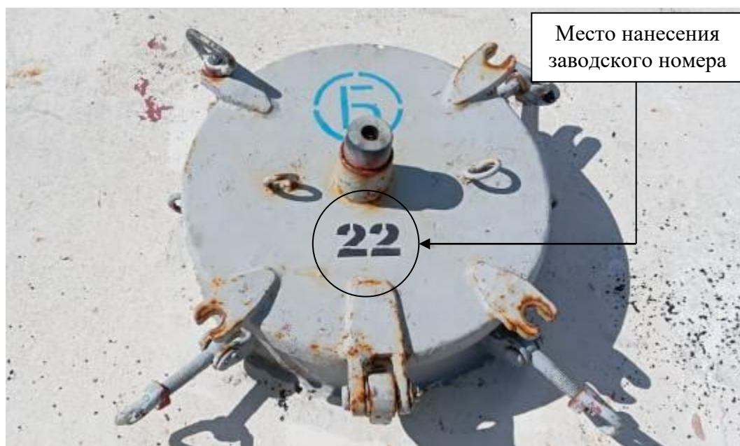
Р и с у н о к 3 – Общий вид замерного люка и места нанесения заводского номера

Заводские номера в виде цифровых обозначений, обеспечивающие идентификацию каждого экземпляра средств измерений, нанесены на замерные люки танков методом окраса. Общий вид замерного люка и место нанесения заводского номера представлены на рисунке 3.