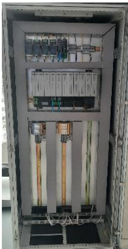
Рисунок 1 – Общий вид стойки модулей ESP3400 в электротехническом шкафу