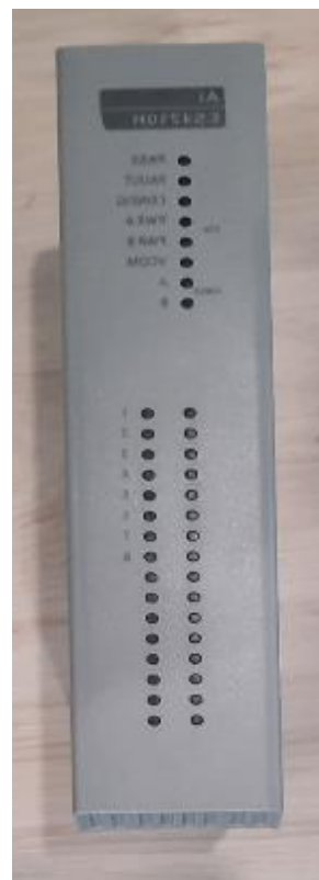
Рисунок 2 – Общий вид модулей ESP3400