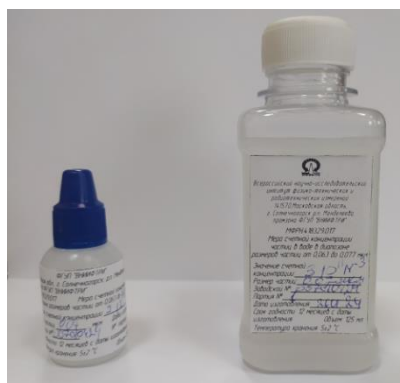
Рисунок 1 – Общий вид мер счетной концентрации частиц в воде МСК-В-0,5