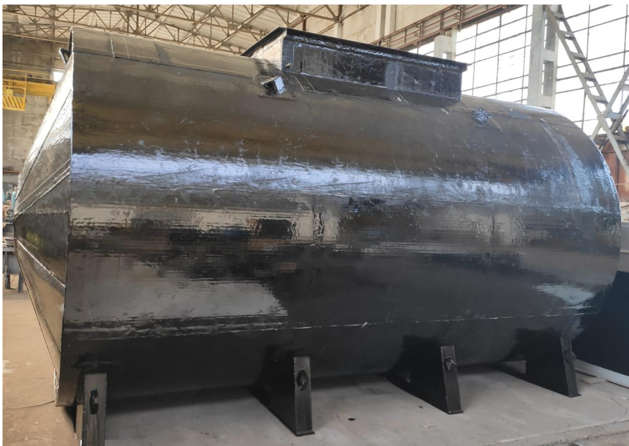
Рисунок 2 – Общий вид резервуара РГСДп-25

Пломбирование резервуара РГСДп-25 не предусмотрено.