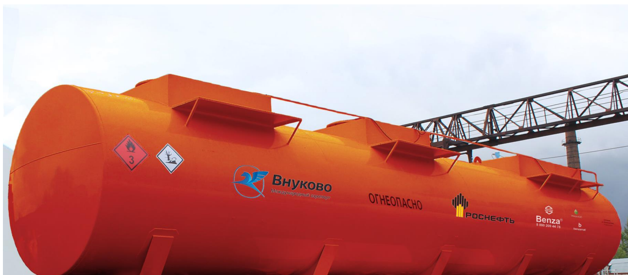
Рисунок 2 – Общий вид резервуара горизонтального Benza 1P-40.3 с заводским номером 309

Для измерений уровня жидкости резервуар оснащен измерительными люками, к которым прикреплена табличка, на которую наносят знак поверки. Табличка крепится таким образом, чтобы ее невозможно было снять без разрушения поверительного клейма.