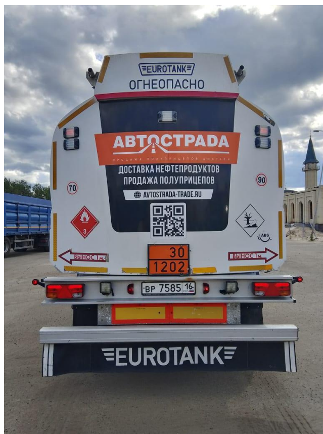
Рисунок 1 – Общий вид полуприцеп-цистерны Eurotank ET-39-6

Схема пломбировки для защиты от несанкционированного изменения положения уровня налива, обозначение места нанесения знака поверки представлены на рисунке 3: