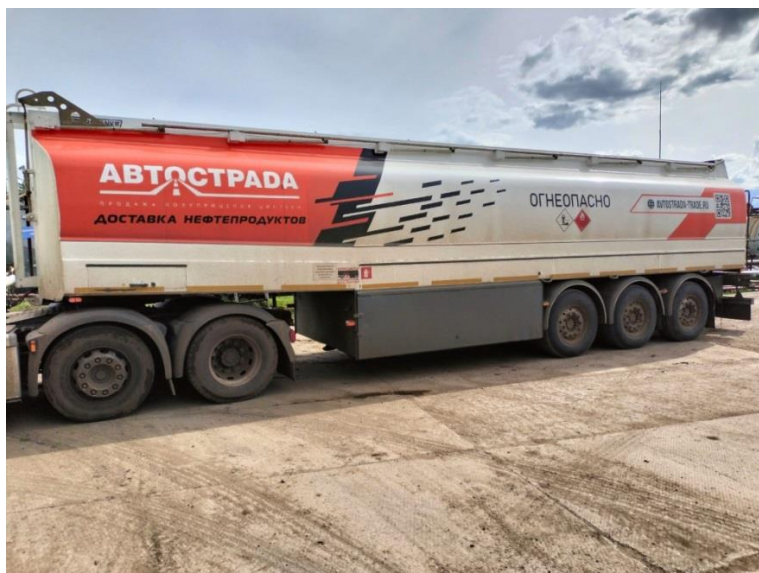
Рисунок 1 – Общий вид полуприцеп-цистерны Eurotank ET-39-6