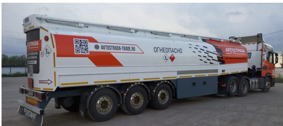
Рисунок 1 – Общий вид полуприцеп-цистерны Eurotank ET-39-6

Общий вид полуприцеп-цистерны Eurotank ET-39-6 зав. № YF912V24SD5049953 представлен на рисунках 1-2.