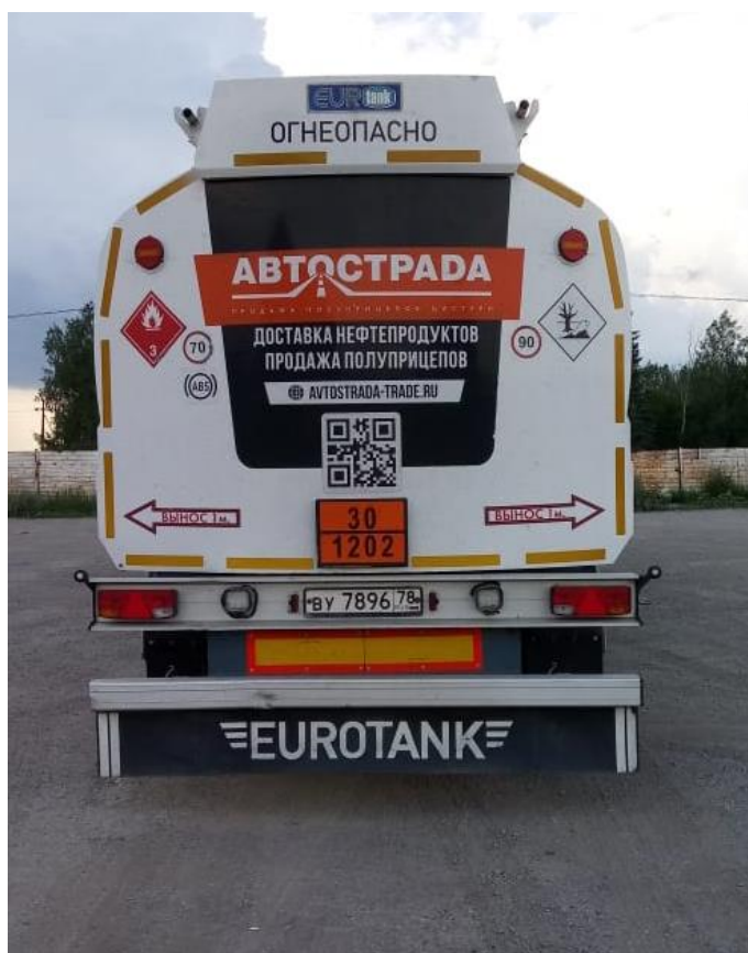
Рисунок 2– Общий вид полуприцеп-цистерны Eurotank ET-39-6

Схема пломбировки для защиты от несанкционированного изменения уровня налива, обозначение места нанесения знака поверки представлены на рисунке 3: