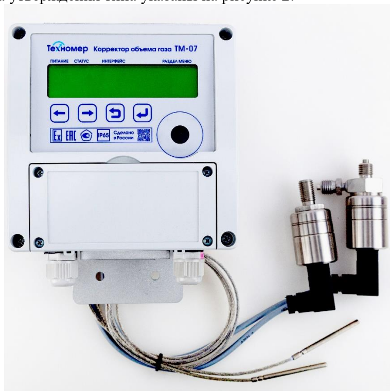
Рисунок 1 – Общий вид корректора

Заводской номер корректора представляет собой цифровой код, состоящий из арабских цифр. Заводской номер наносится типографическим способом на шильдик, размещенный на левой стороне корпуса корректора, печатается в паспорте на корректор и записывается в энергонезависимую память корректора при выпуске из производства. Места расположения заводского номера и знака утверждения типа указаны на рисунке 2.