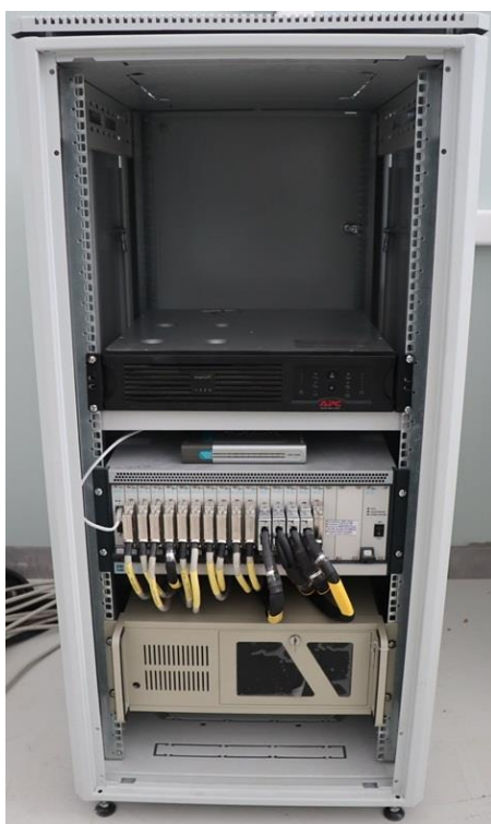
Р и с у н о к 1 – Общий вид ПК АРМ с указанием места нанесения заводского номера и знака утверждения типа