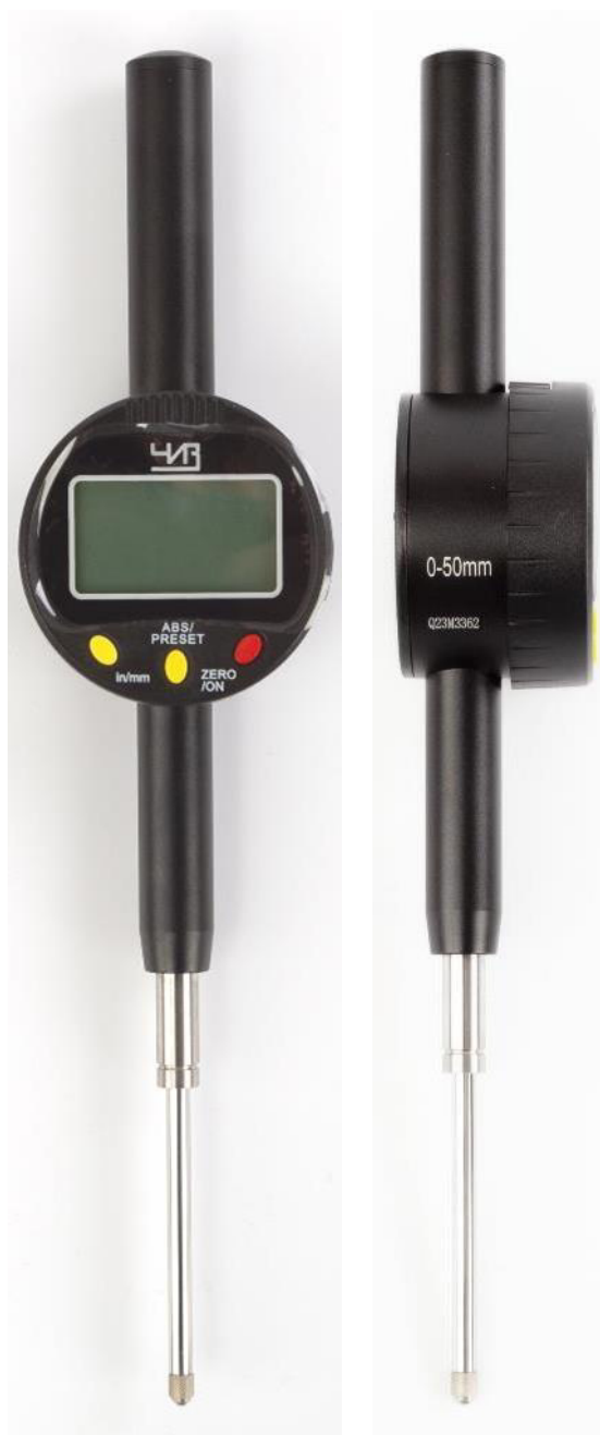
Рисунок 7 – Общий вид индикаторов модификации ИЧЦ