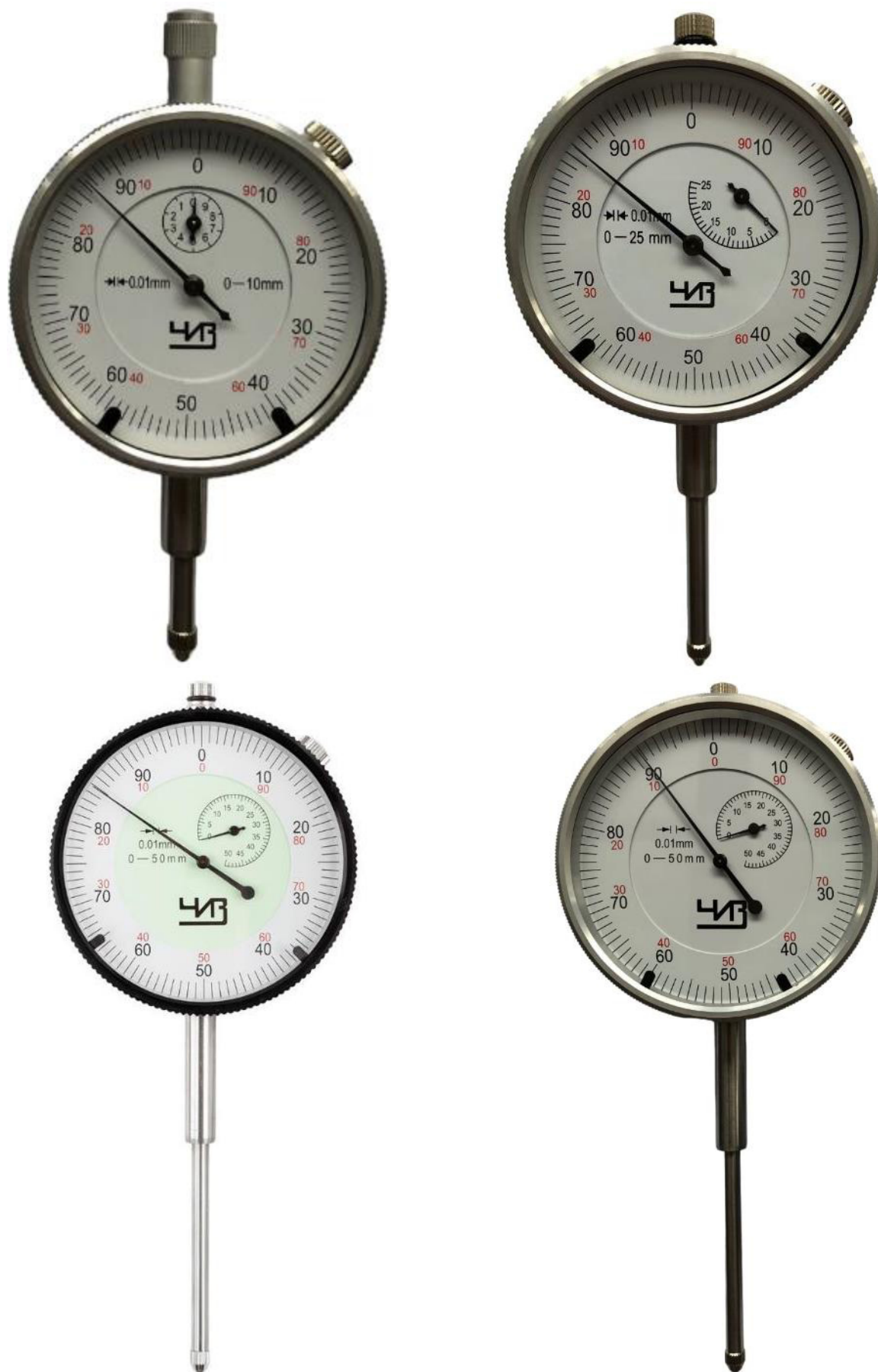
Рисунок 3 – Общий вид индикаторов модификации ИЧ