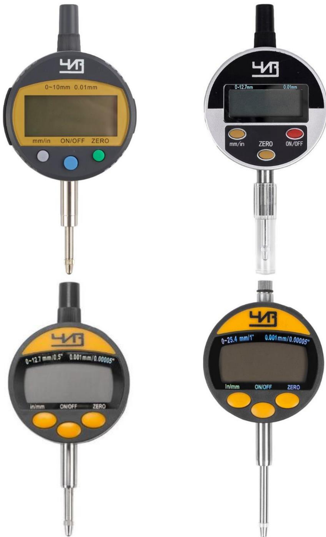
Рисунок 5 – Общий вид индикаторов модификации ИЦЦ