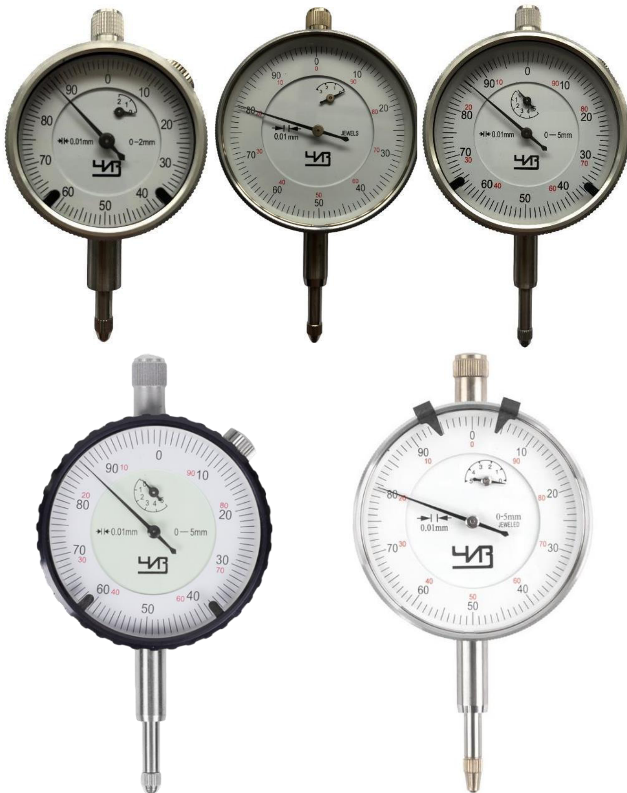
Рисунок 2 – Общий вид индикаторов модификации ИЧ