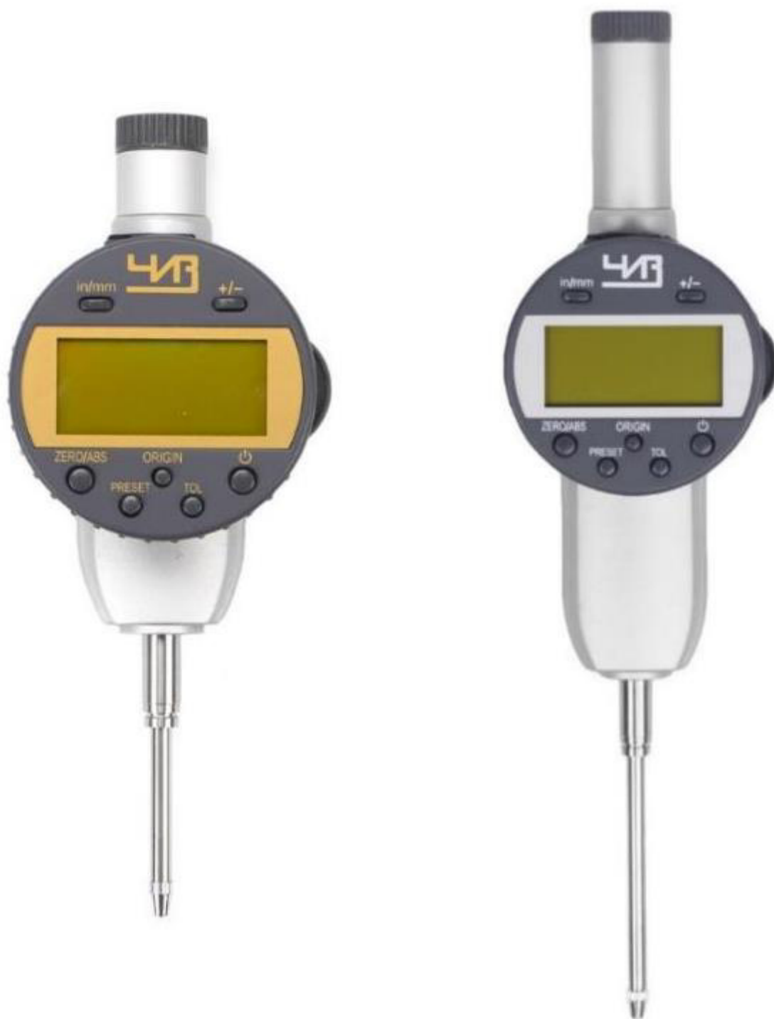
Рисунок 8 – Общий вид индикаторов модификации ИЧЦ