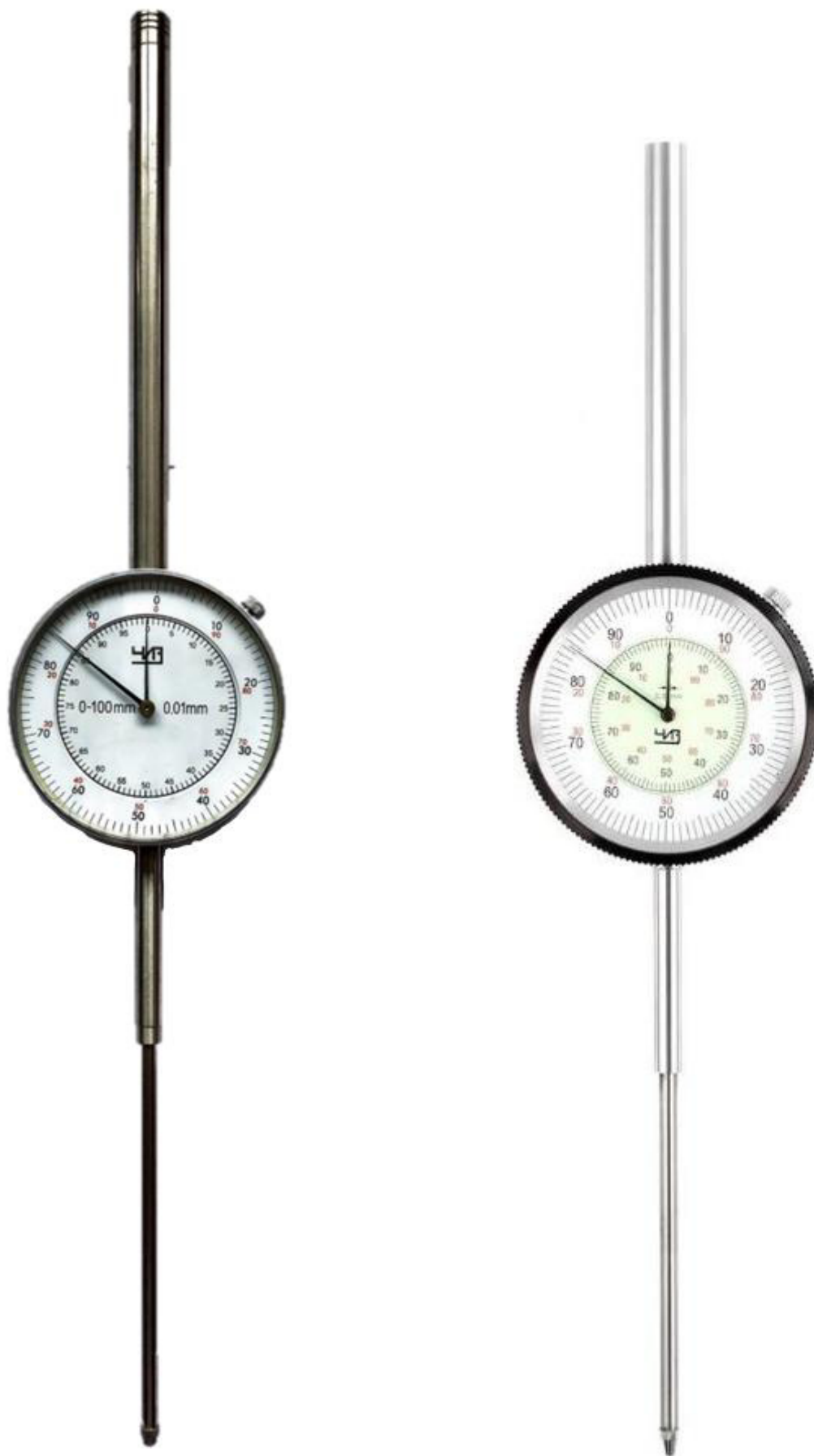
Рисунок 4 – Общий вид индикаторов модификации ИЧ