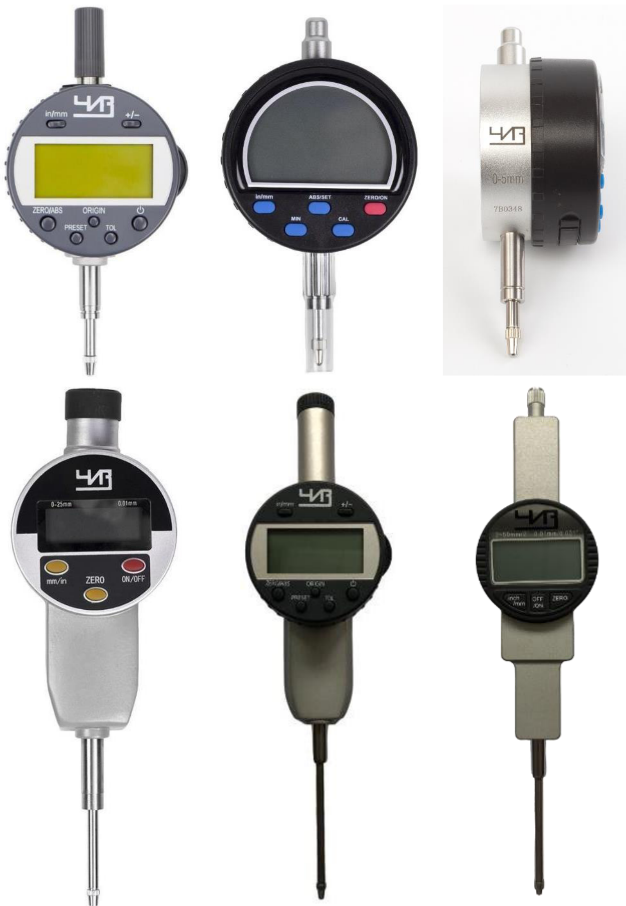
Рисунок 6 – Общий вид индикаторов модификации ИЧЦ