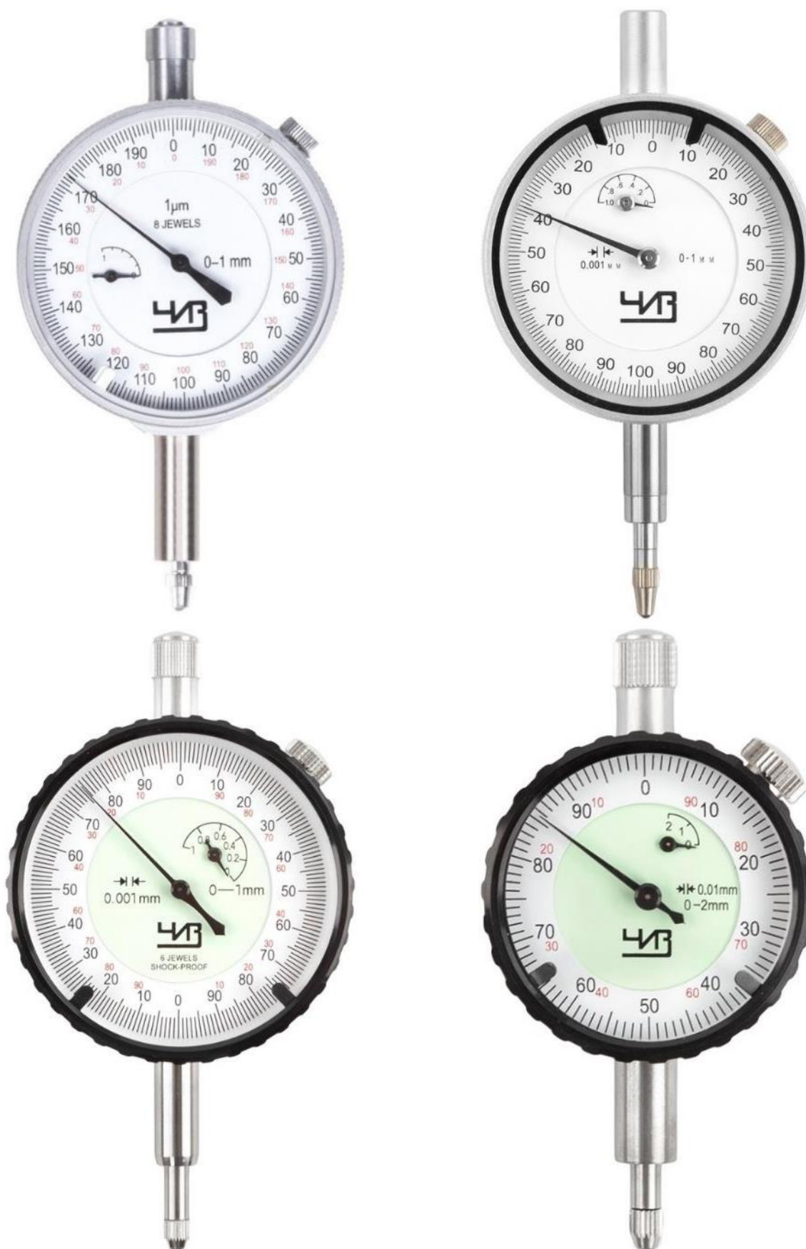
Рисунок 1 – Общий вид индикаторов модификации ИЧ