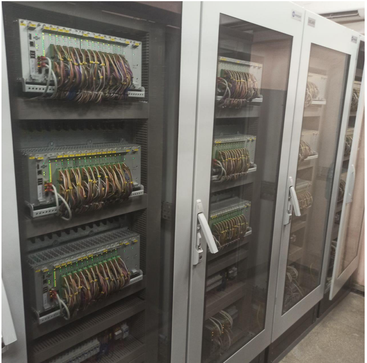
Рисунок 1 – Общий вид шкафа ПТК