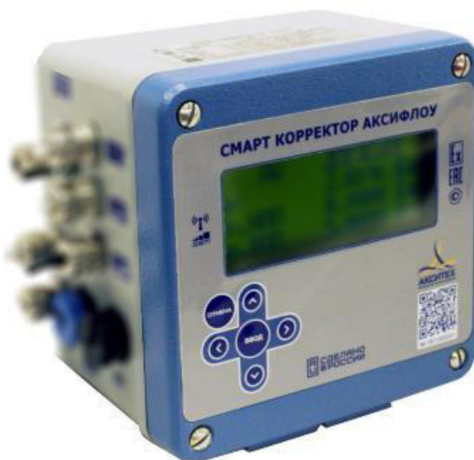
Рисунок 1 – Общий вид смарт корректора АКСИФЛОУ

На рисунке 1 приведен общий вид смарт корректора АКСИФЛОУ.