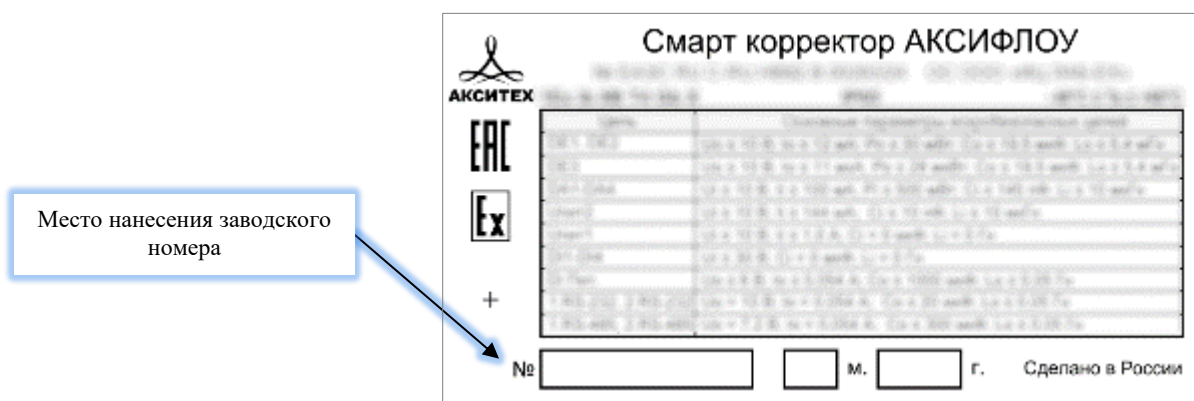
Рисунок 3 – Общий вид шильдика смарт корректора АКСИФЛОУ

Схема пломбирования корректоров от несанкционированного доступа, обозначение места нанесения знака поверки представлены на рисунке 4.