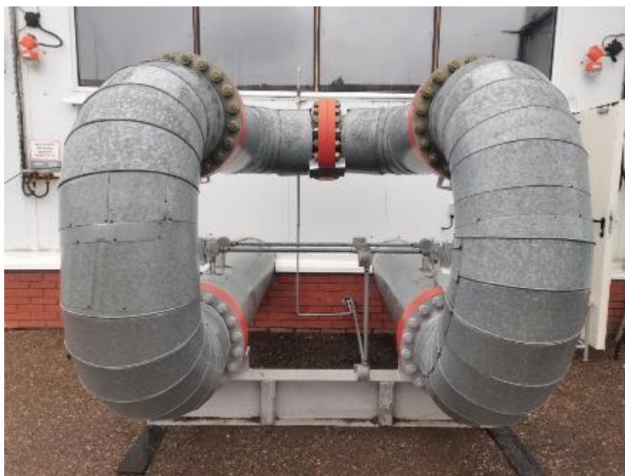
Рисунок 1 – Общий вид ТПУ

Установка пломб на ТПУ осуществляется с помощью проволоки и свинцовых (пластмассовых) пломб с нанесением знака поверки давлением на пломбы, установленные на контрольных проволоках, пропущенных через отверстия завернутых винтов крепления сигнализаторов прохождения шарового поршня и в их крышке клеммной коробки, а также через отверстия в двух контрольных гайках на шпильках, расположенных диаметрально противоположно на всех присоединительных фланцах калиброванного участка.