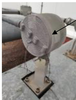
Места установки пломб

Знак поверки наносится на пломбы, установленные в соответствии с рисунком 2.