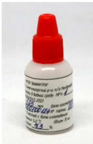
Рисунок 1 – Общий вид мер размеров частиц в водной среде МРЧ-1