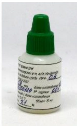
Рисунок 1 – Общий вид мер размеров частиц в водной среде МРЧ-0,6