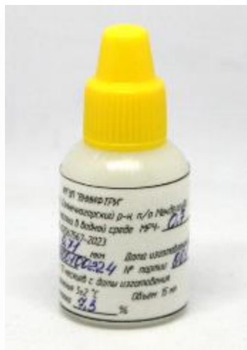
Рисунок 1 – Общий вид мер размеров частиц в водной среде МРЧ-0,7