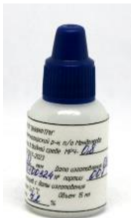
Рисунок 1 – Общий вид мер размеров частиц в водной среде МРЧ-0,8