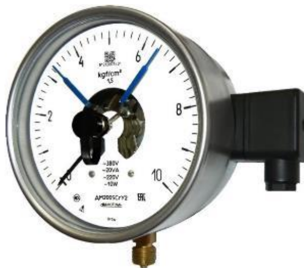
Рисунок 4 – Общий вид манометров ДМ2005Сг