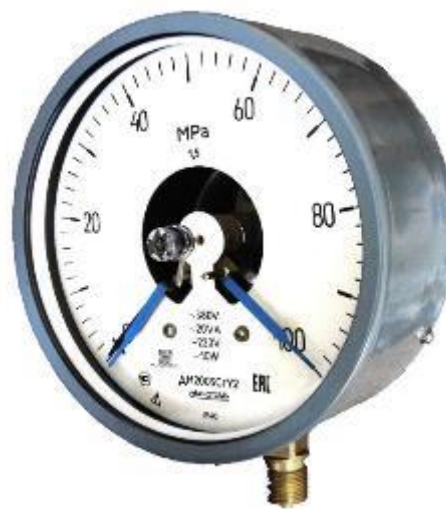
Рисунок 6 – Общий вид манометров ДМ2005Сг