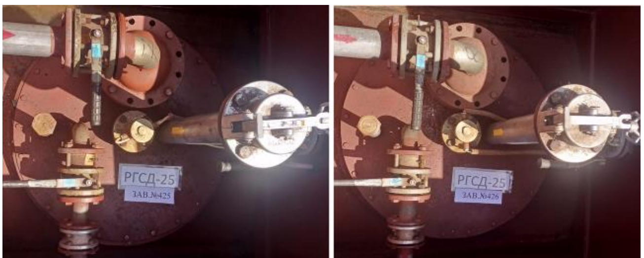
Рисунок 3 – Горловины и измерительные люки резервуаров РГСД-25 зав.№№ 425, 426