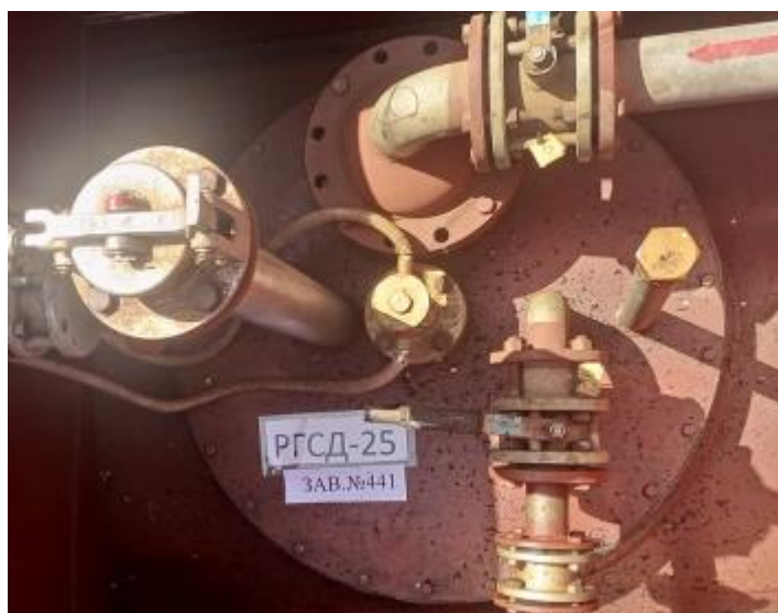
Рисунок 4 – Горловина и измерительный люк резервуара РГСД-25 зав.№ 441

Пломбирование резервуаров РГСД-25 не предусмотрено.