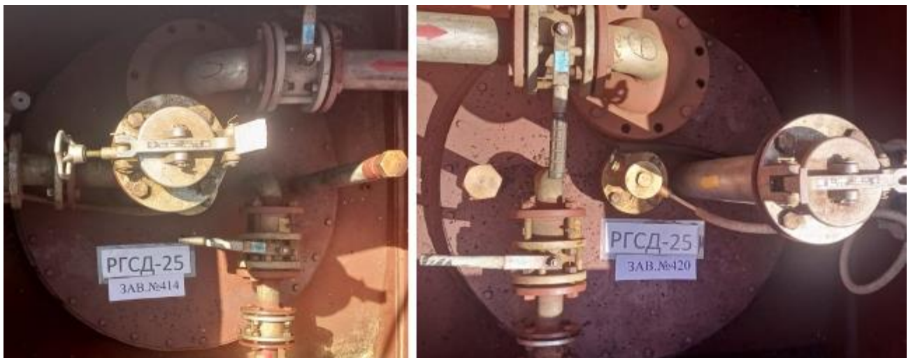
Рисунок 2 – Горловины и измерительные люки резервуаров РГСД-25 зав.№№ 414, 420