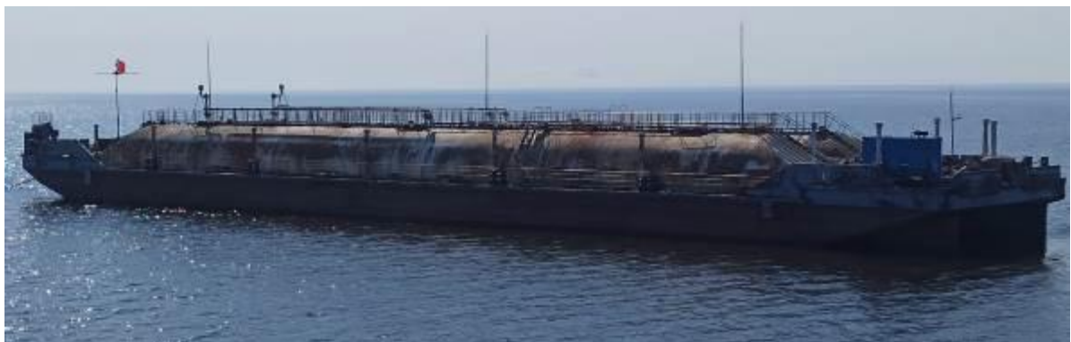
Р и с у н о к 1 – Общий вид нефтеналивной баржи НБ-1

Общий вид нефтеналивной баржи НБ-1 представлен на рисунке 1. Схематичное расположение танков на палубе нефтеналивной баржи НБ-1 представлено на рисунке 2.