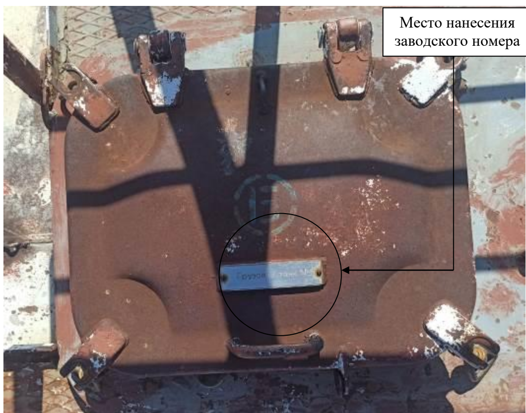
Р и с у н о к 3 – Общий вид замерного люка и места нанесения заводского номера

Заводские номера в виде цифровых обозначений, обеспечивающие идентификацию каждого экземпляра средств измерений, нанесены на замерные люки танков в виде номерных табличек. Общий вид замерного люка и место нанесения заводского номера представлены на рисунке 3.