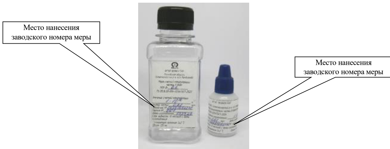
Рисунок 1 – Общий вид мер счетной концентрации частиц в воде МСК-В-0,6