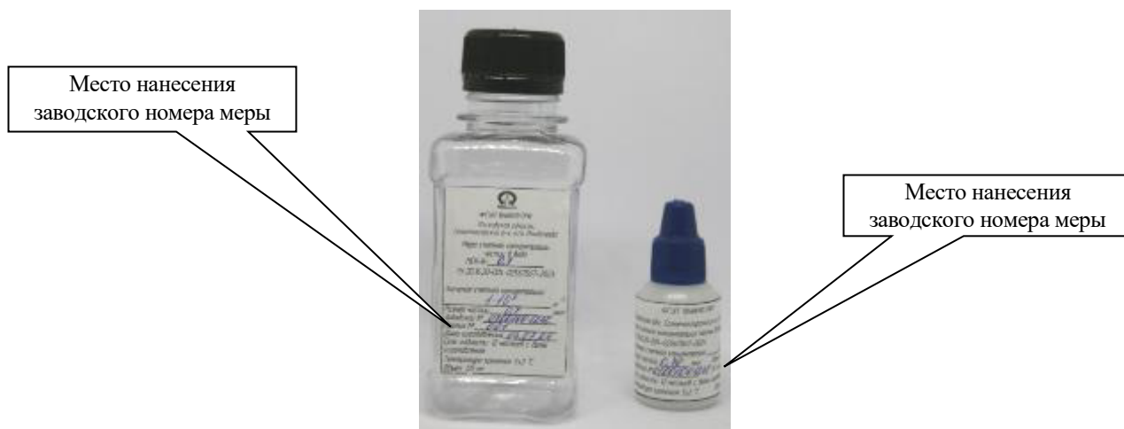
Рисунок 1 – Общий вид мер счетной концентрации частиц в воде МСК-В-0,7