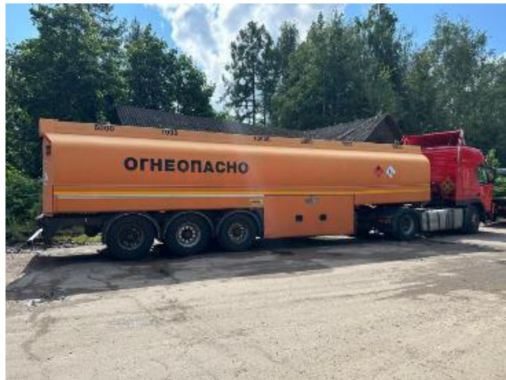
Рисунок 1 – Общий вид полуприцепов-цистерн Eurotank