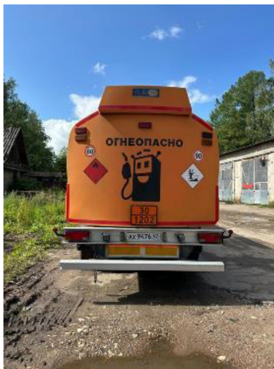
Рисунок 2 – Общий вид полуприцепов-цистерн Eurotank

Схема пломбировки для защиты от несанкционированного изменения положения уровня налива, обозначение места нанесения знака поверки представлены на рисунке 3: