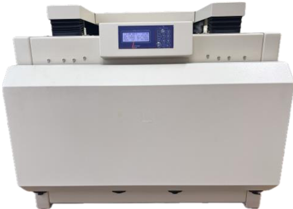
Рисунок 1 – Общий вид прибора для измерения теплопроводности FOX 600