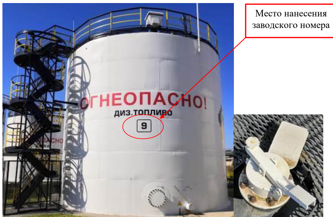
Рисунок 1 – Общий вид резервуара и замерного люка РВС-700 зав. № 9