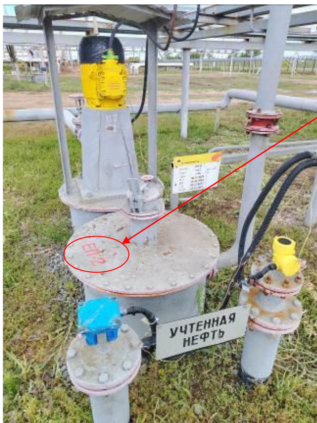
Рисунок 2 – Общий вид резервуара и замерного люка РГС-8 зав. № ЕП-1