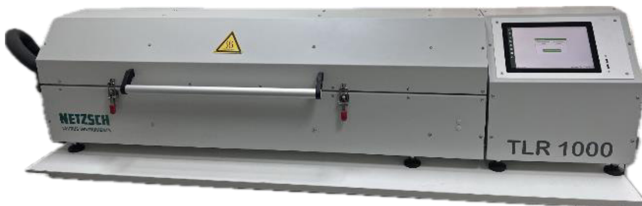
Рисунок 1 – Общий вид прибора для измерения теплопроводности TLR 1000