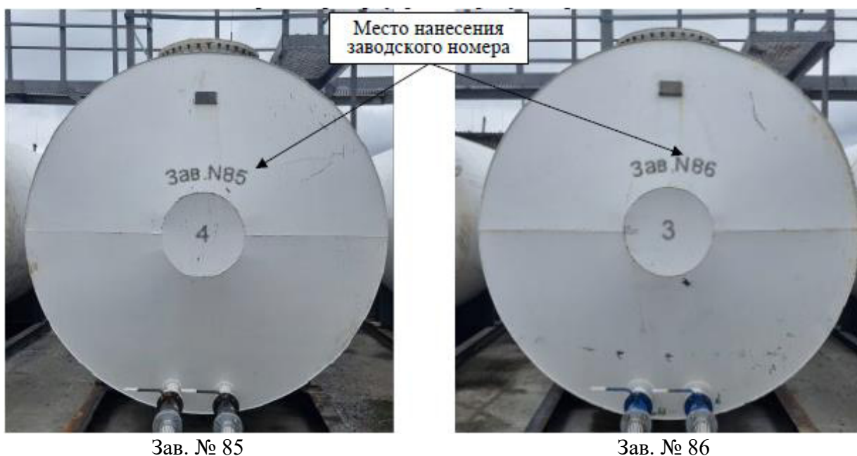
Рисунок 1 – Общий вид резервуаров, зав. № 85, 86