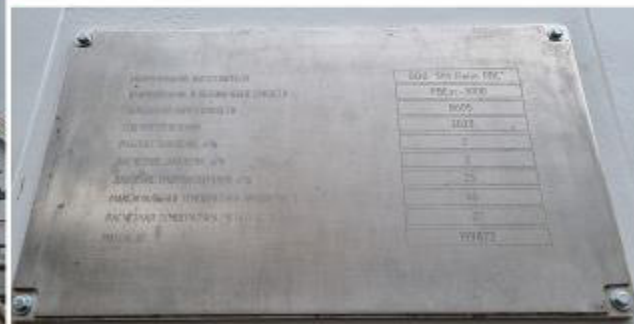
Рисунок 1 – Общий вид маркировочной таблички и резервуара РВСзс-3000 зав.№ 8605