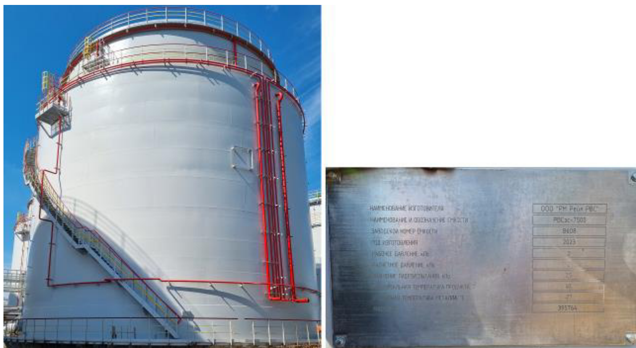
Рисунок 3 – Общий вид маркировочной таблички и резервуара РВСзс-7500 зав.№ 8608

Пломбирование резервуаров РВСзс не предусмотрено.