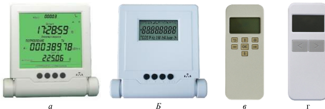
Рисунок 6 – Общий вид дистанционного индикаторного устройства