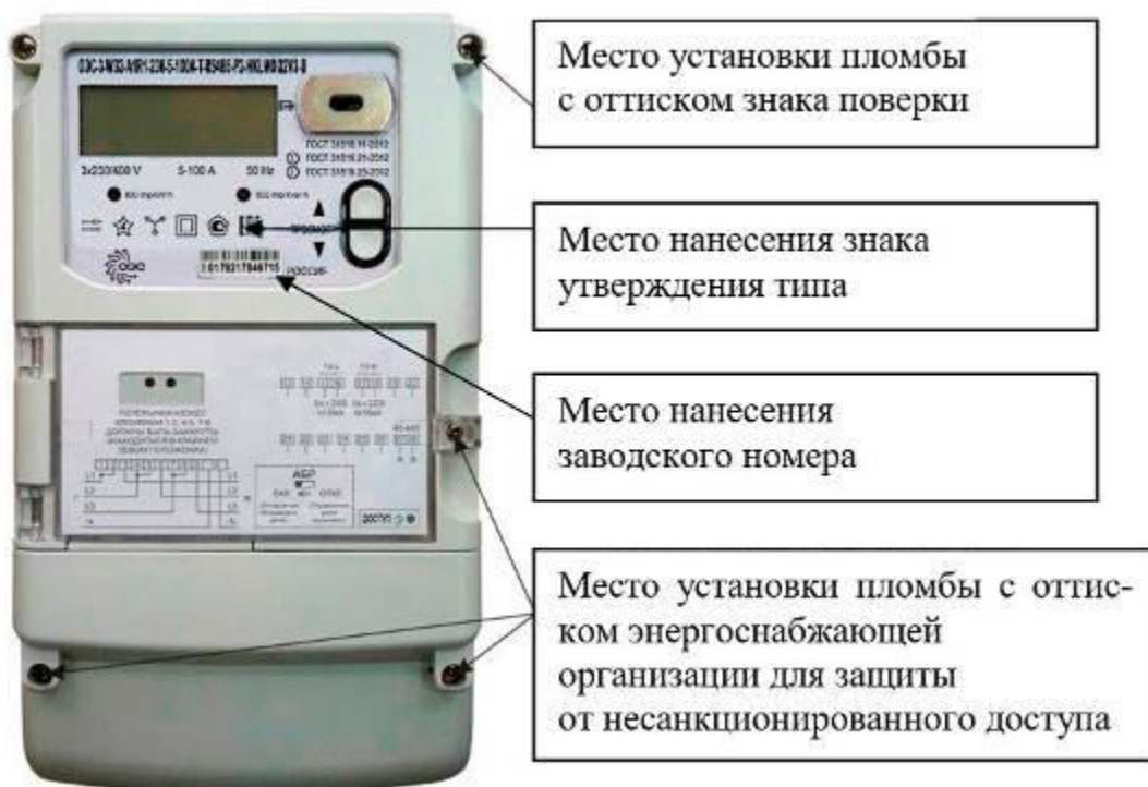
Рисунок 1 – Общий вид счетчика в корпусе типа W32

Общий вид счетчиков, с указанием мест пломбировки, мест нанесения знака утверждения типа, знака поверки, заводского номера приведен на рисунках 1 – 5. Общий вид дистанционного индикаторного устройства приведен на рисунке 6.