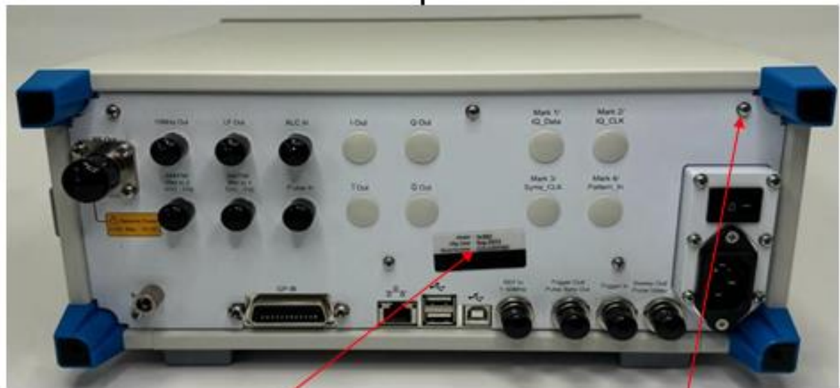
Рисунок 1 – Общий вид средства измерений