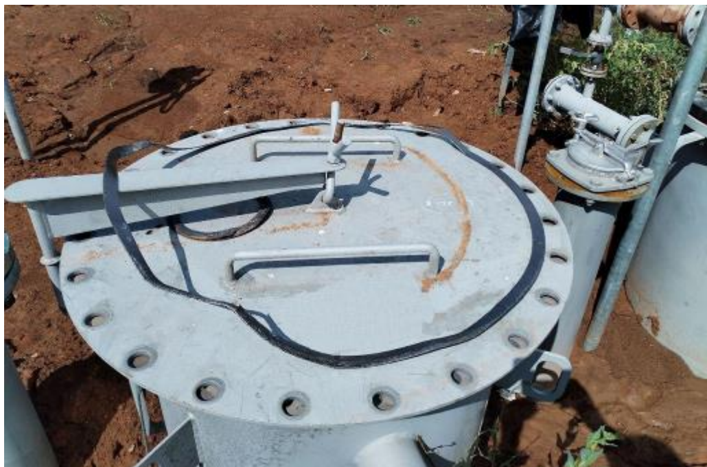
Рисунок 4 – Горловины резервуара ЕП-12,5-1990-1260 зав.№ 165

Пломбирование резервуаров ЕП-12,5-1990-1260 не предусмотрено.