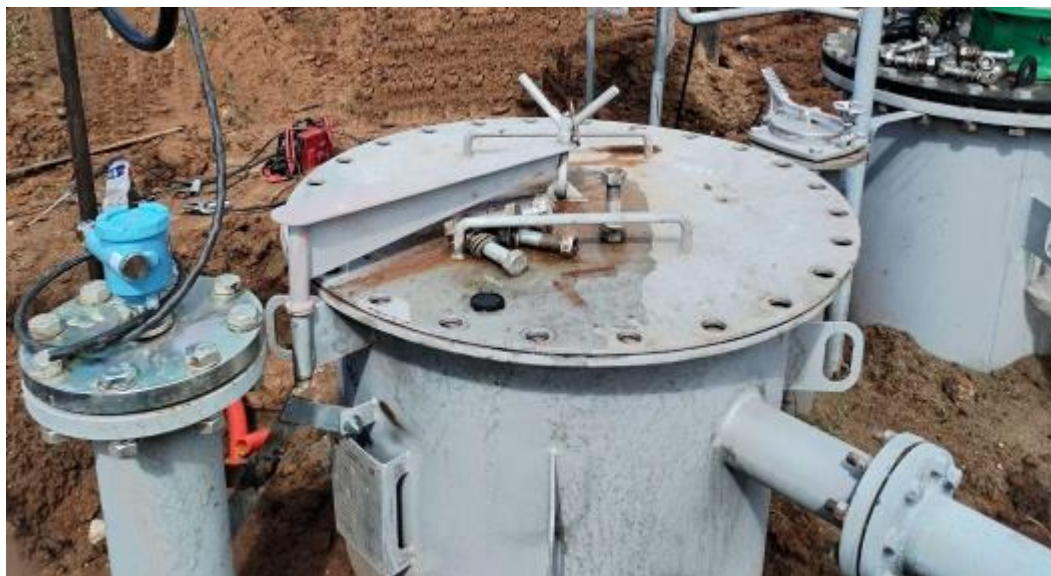
Рисунок 3 – Горловины резервуара ЕП-12,5-1990-1260 зав.№ 160