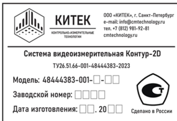
Рисунок 2– Внешний вид таблички

Общий вид систем представлен на рисунке 3.