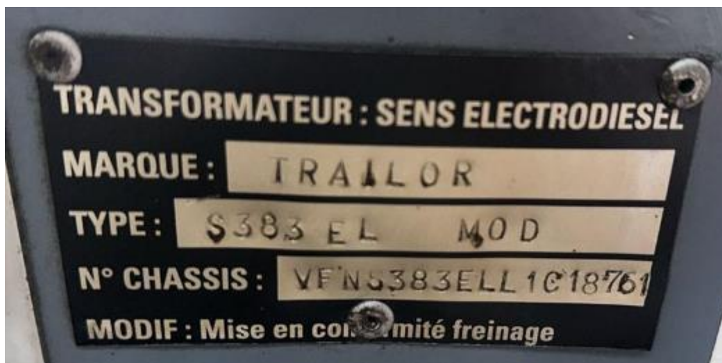
Рисунок 3 - Общий вид маркировочной таблички ППЦ

Схема пломбировки для защиты от несанкционированного изменения положения уровня налива, обозначение места нанесения знака проверки представлены на рисунке 4: