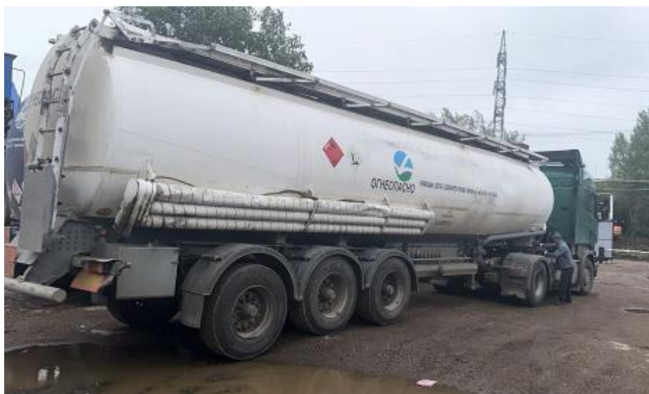
Рисунок 1 – Общий вид ППЦ