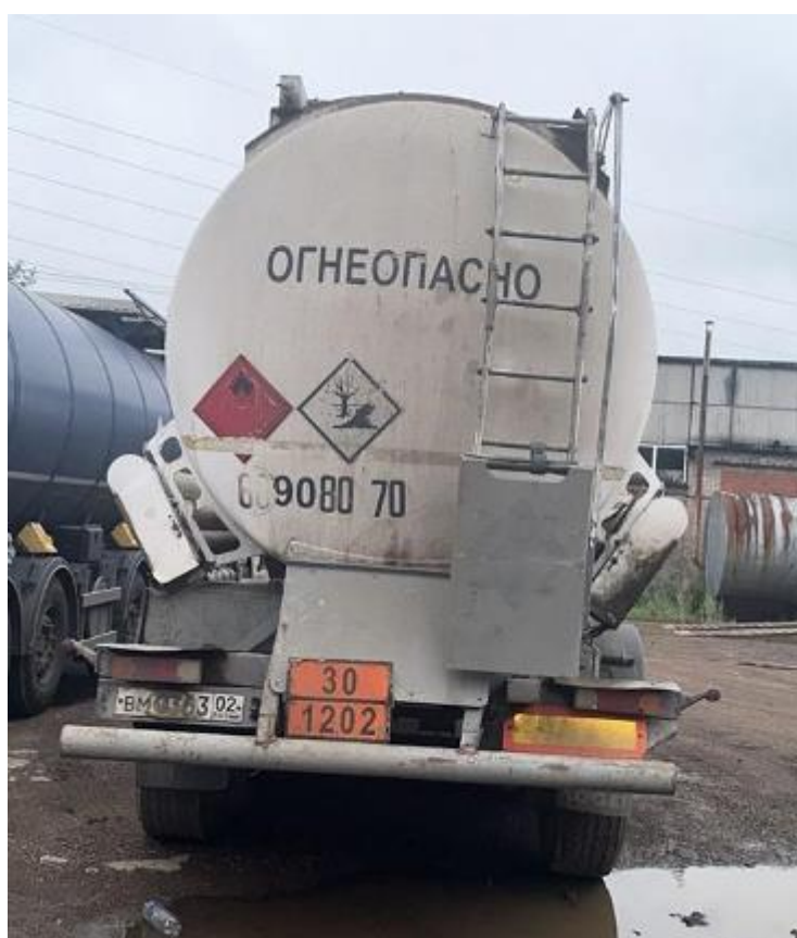
Рисунок 2 – Общий вид ППЦ