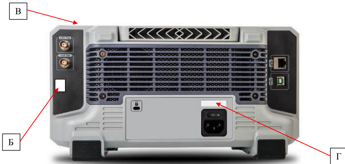
Рисунок 2 – Схема пломбировки от несанкционированного доступа (Б), место нанесения знака поверки (В) и место нанесения серийного номера (Г)