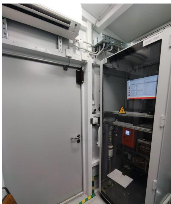
Рисунок 4 – Общий вид ИВК