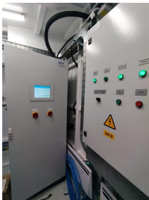
Рисунок 3 – Общий вид газоаналитического комплекса MCS100FT