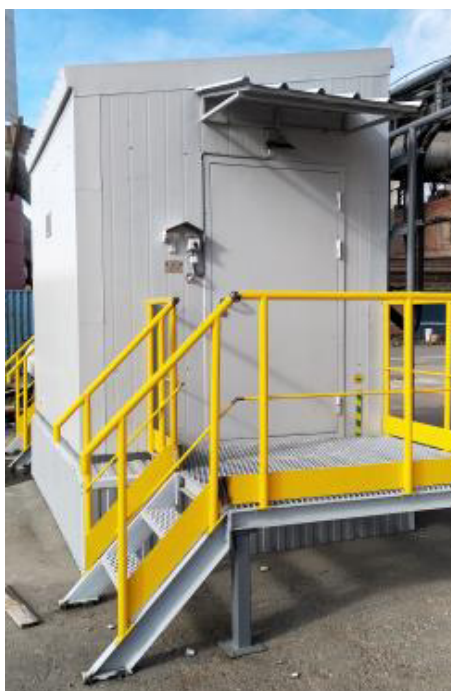
Рисунок 1 – Общий вид блок-бокса, в котором размещен газоаналитический комплекс MCS100FT и ИВК