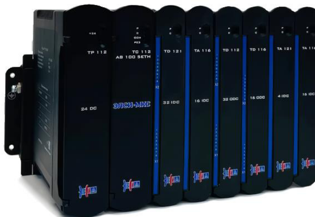
Рисунок 1 – Общий вид СИ