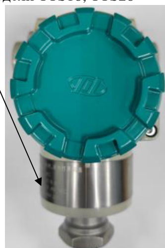
Рисунок 3 – Общий вид преобразователей температуры TTS с указанием мест нанесения заводского номера