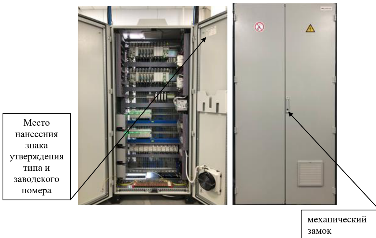
Рисунок 1 – Общий вид шкафов комплекса

Общий вид шкафов комплекса приведен на рисунке 1.