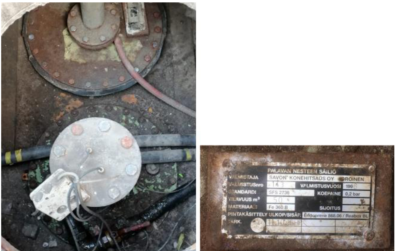
Рисунок 4 – Маркировочная табличка и горловины резервуара РГС-50 зав.№ 143