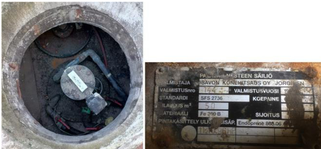
Рисунок 5 – Маркировочная табличка и горловины резервуара РГС-50 зав.№ 144