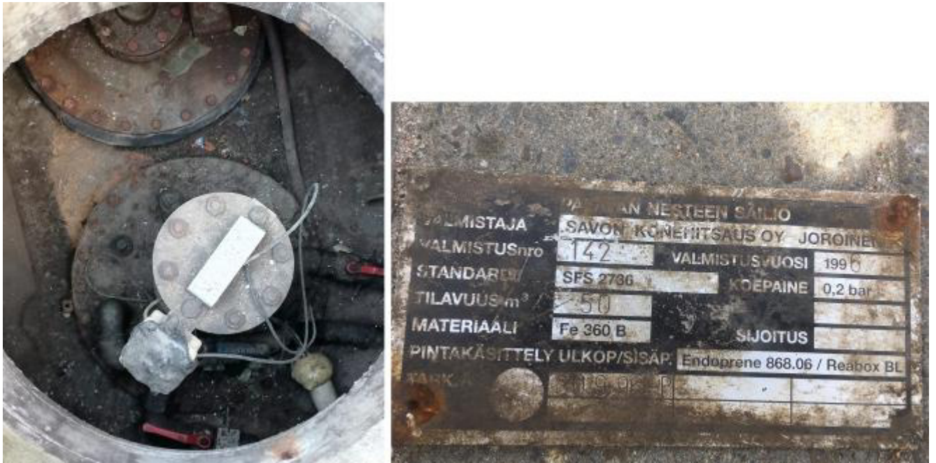
Рисунок 3 – Маркировочная табличка и горловины резервуара РГС-50 зав.№ 142