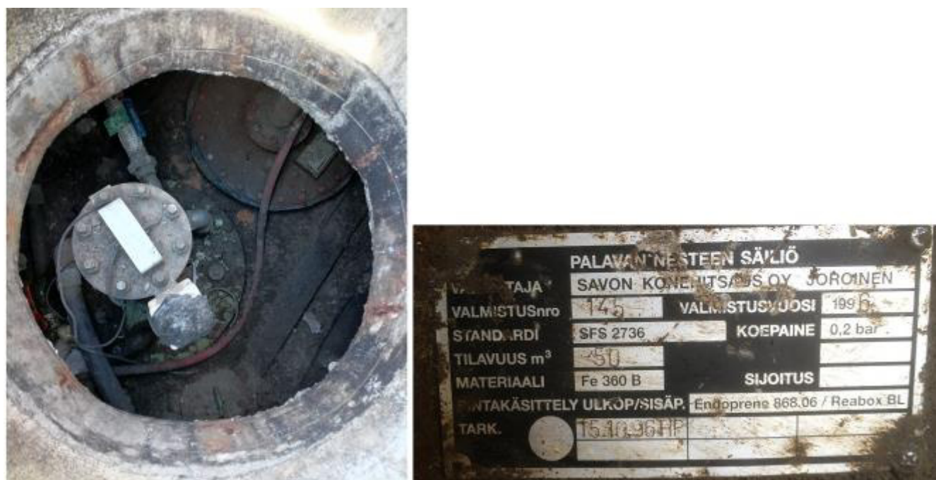
Рисунок 6 – Маркировочная табличка и горловины резервуара РГС-50 зав.№ 145

Пломбирование резервуаров РГС-50 не предусмотрено.