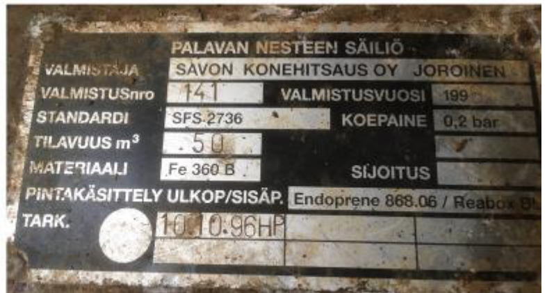
Рисунок 2 – Маркировочная табличка и горловины резервуара РГС-50 зав.№ 141