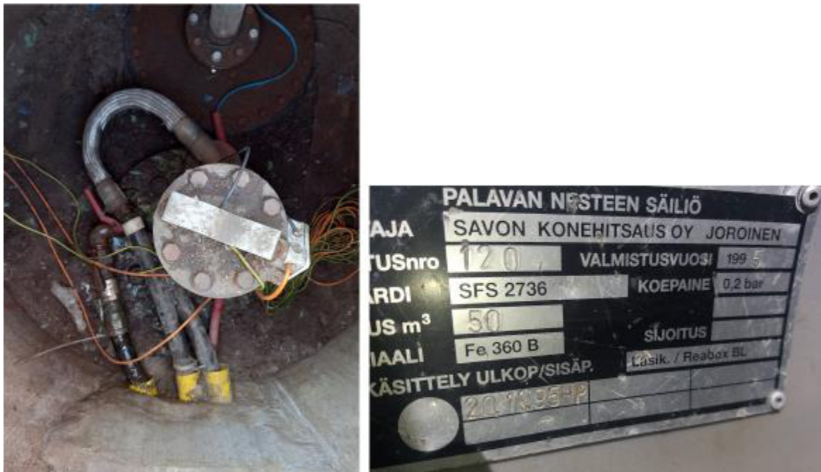
Рисунок 6 – Маркировочная табличка и горловины резервуара РГС-50 зав.№ 120

Пломбирование резервуаров РГС-50 не предусмотрено.