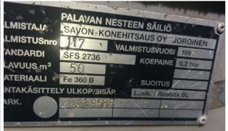
Рисунок 3 – Маркировочная табличка и горловины резервуара РГС-50 зав.№ 117