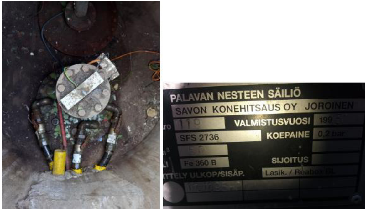
Рисунок 5 – Маркировочная табличка и горловины резервуара РГС-50 зав.№ 119