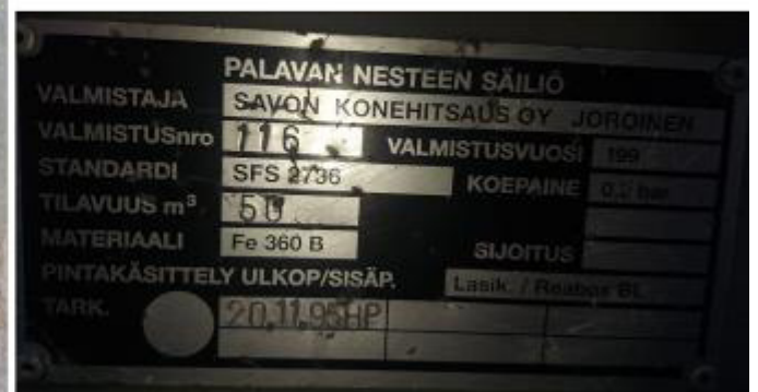
Рисунок 2 – Маркировочная табличка и горловины резервуара РГС-50 зав.№ 116