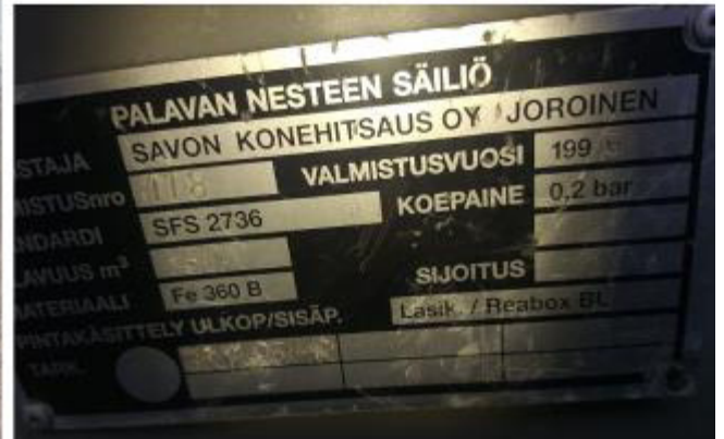
Рисунок 4 – Маркировочная табличка и горловины резервуара РГС-50 зав.№ 118