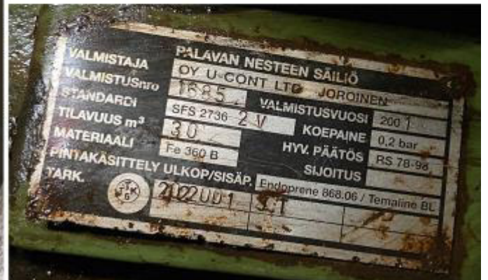
Рисунок 2 – Маркировочная табличка и горловины резервуара РГС-30 зав.№ 1685