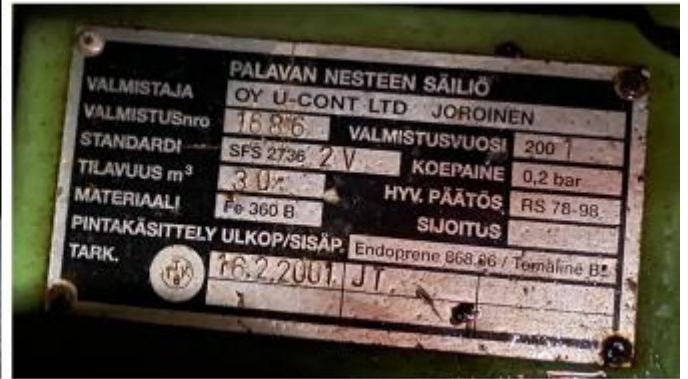
Рисунок 3 – Маркировочная табличка и горловины резервуара РГС-30 зав.№ 1686