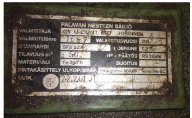
Рисунок 4 – Маркировочная табличка и горловины резервуара РГС-50 зав.№ 1687

Пломбирование резервуаров РГС не предусмотрено.