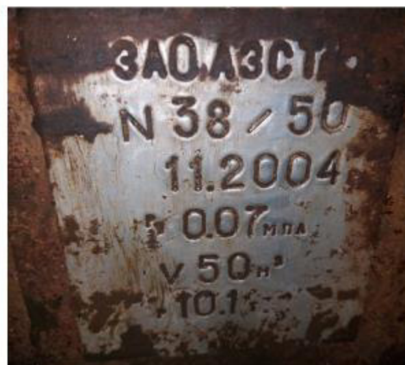
Рисунок 6 – Маркировочная табличка и горловины резервуара РГС-50 зав.№ 38/50

Пломбирование резервуаров РГС не предусмотрено.