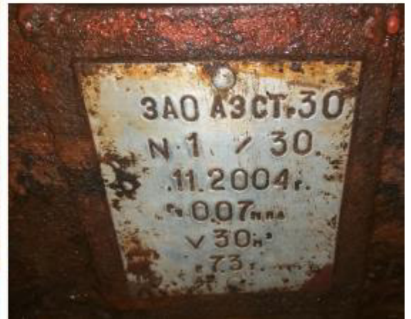
Рисунок 2 – Маркировочная табличка и горловины резервуара РГС-30 зав.№ 1/30