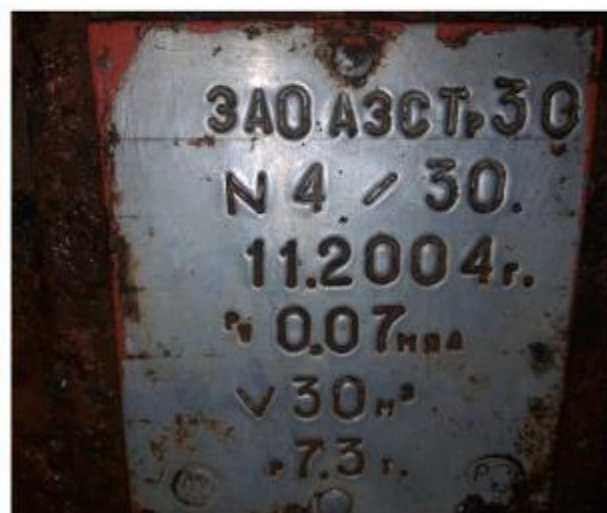
Рисунок 5 – Маркировочная табличка и горловины резервуара РГС-30 зав.№ 4/30