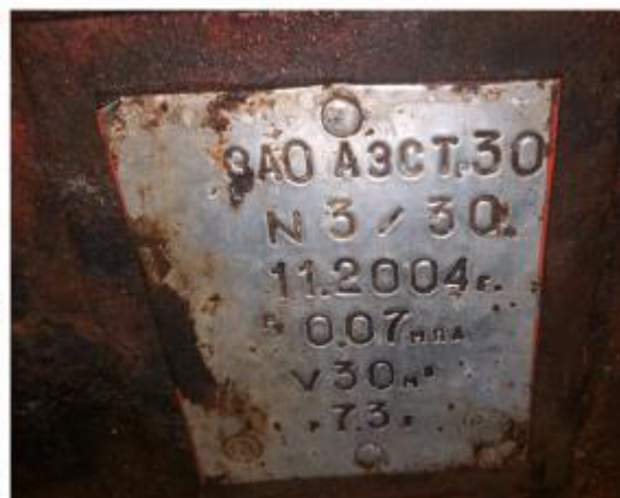
Рисунок 4 – Маркировочная табличка и горловины резервуара РГС-30 зав.№ 3/30