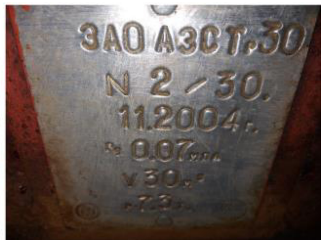
Рисунок 3 – Маркировочная табличка и горловины резервуара РГС-30 зав.№ 2/30