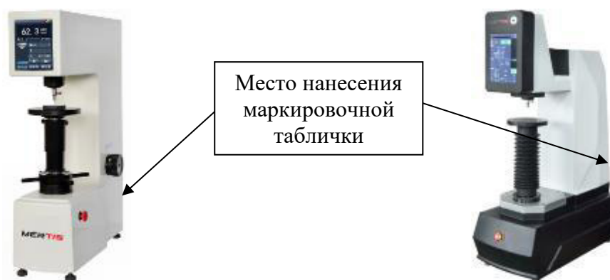
Рисунок 5 – Общий вид твердомеров Роквелла и Супер-Роквелла MERTIS XHRS-150