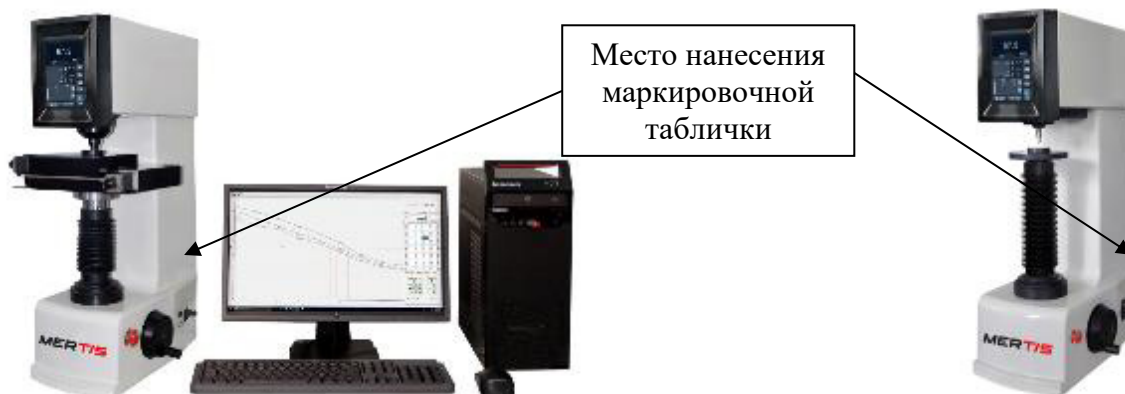
Рисунок 7 – Общий вид твердомеров Роквелла и Супер-Роквелла MERTIS 560RSSZ/V3.0